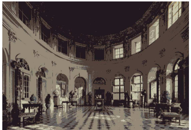
Le grand salon

La décoration est due à LE BRUN qui donna libre cours à son talent. Il dessinera, également, les meubles et les statues. Le style Louis XIV apparaît pour la première fois, à Vaux.