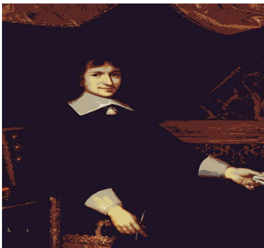
Portrait de Fouquet par Ch. Le Brun.

La décoration est due à LE BRUN qui donna libre cours à son talent. Il dessinera, également, les meubles et les statues. Le style Louis XIV apparaît pour la première fois, à Vaux.