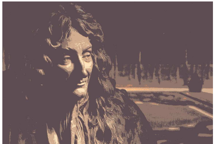
Buste de La Fontaine, terre cuite de Houdon, 1782

Habile adjoint de Mazarin, mais ayant sous-estimé la volonté royale, FOUQUET connut la prison à vie, pendant 19 ans, à Pignerol, dans les Alpes savoyardes. La Fontaine resta son ami.