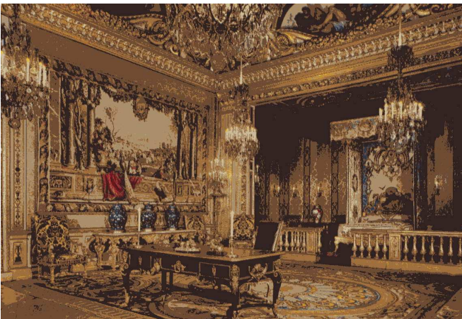
La chambre du roi

LE VAU édifia le château en grès de Fontainebleau et pierre de Creil, sur une motte artificielle cernée de douves, avec la complicité de LE NÔTRE.