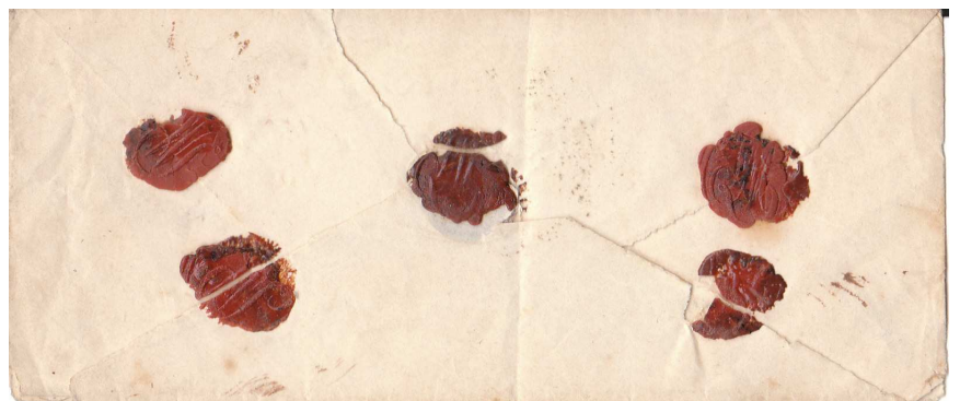
Lettre sous enveloppe scellée de 5 cachets de cire avec empreintes