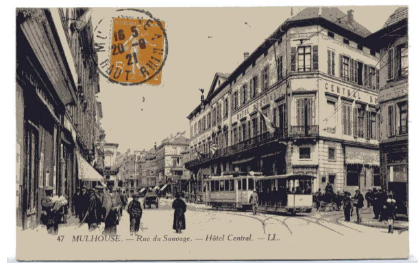
L'Hôtel des Postes et le canal du Rhône au Rhin. La rue du Sauvage et l'Hôtel Central.