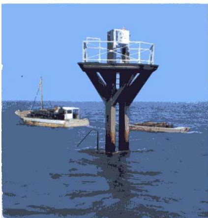
Le passage du Gois est enjambé par un pont à péage depuis 1971.