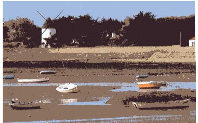
Le petit port de La Guérinière et son moulin.

Les Noirmoutrins se livrent, en partie, à la pêche à la sardine au petit port de L'Herbaudière ; d'autres font le cabotage pour le transport du sel et des primeurs.