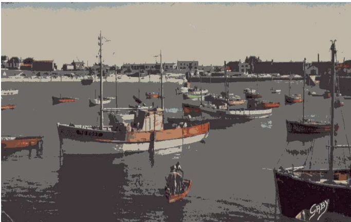
Le port de L'Herbaudière en 1950.

Trois balises-refuges servent à recueillir les voyageurs surpris par la marée montante.