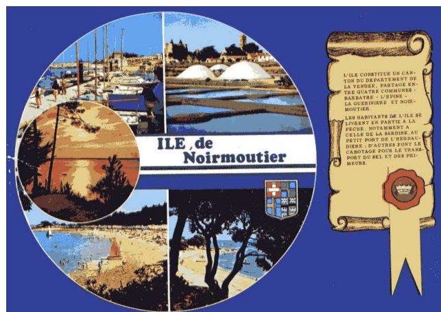
Huîtres, sel, varech, soude y sont exploités, mais la grande ressource demeure le tourisme.