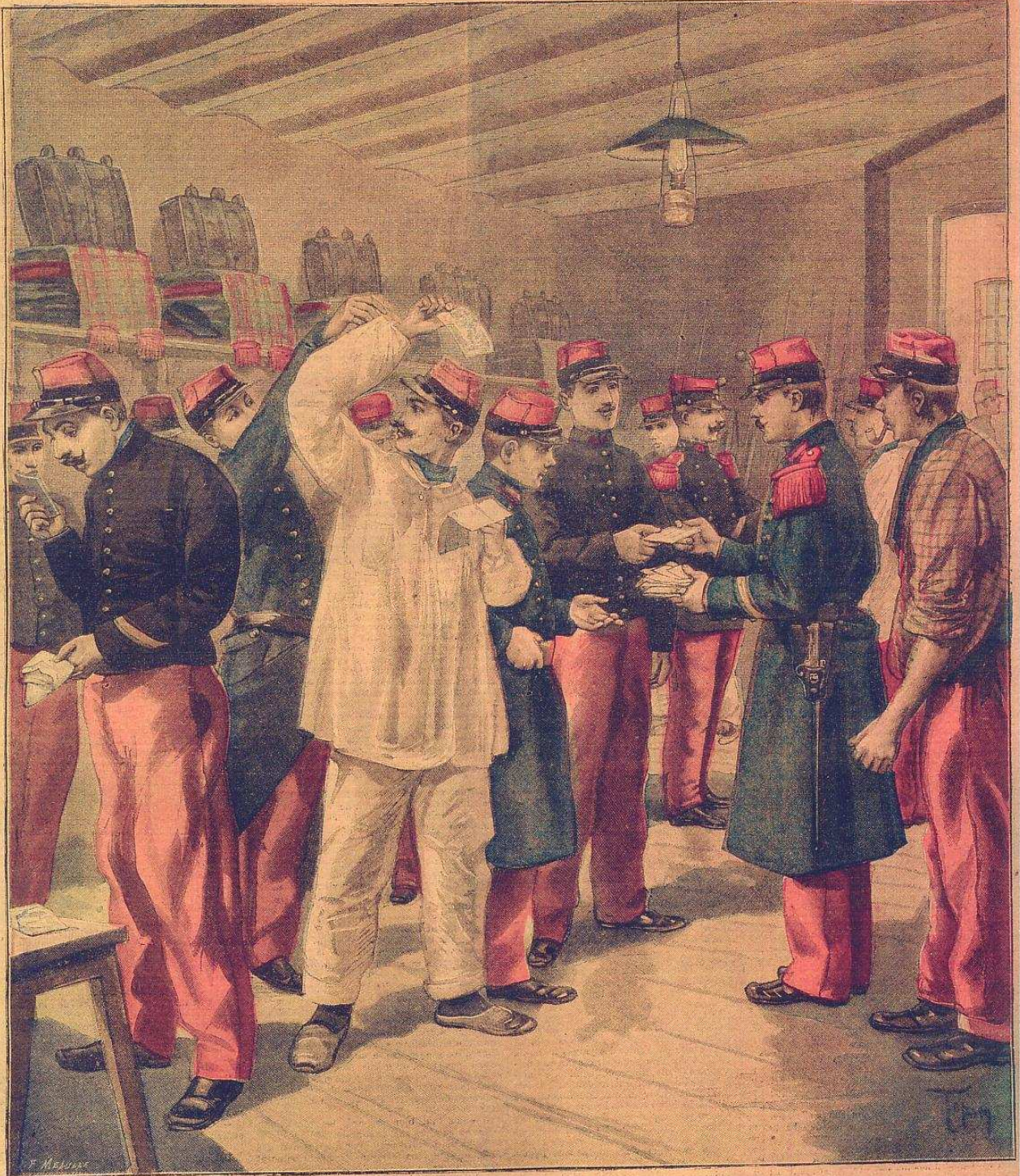
LE JOUR DE L'AN A LA CASERNE