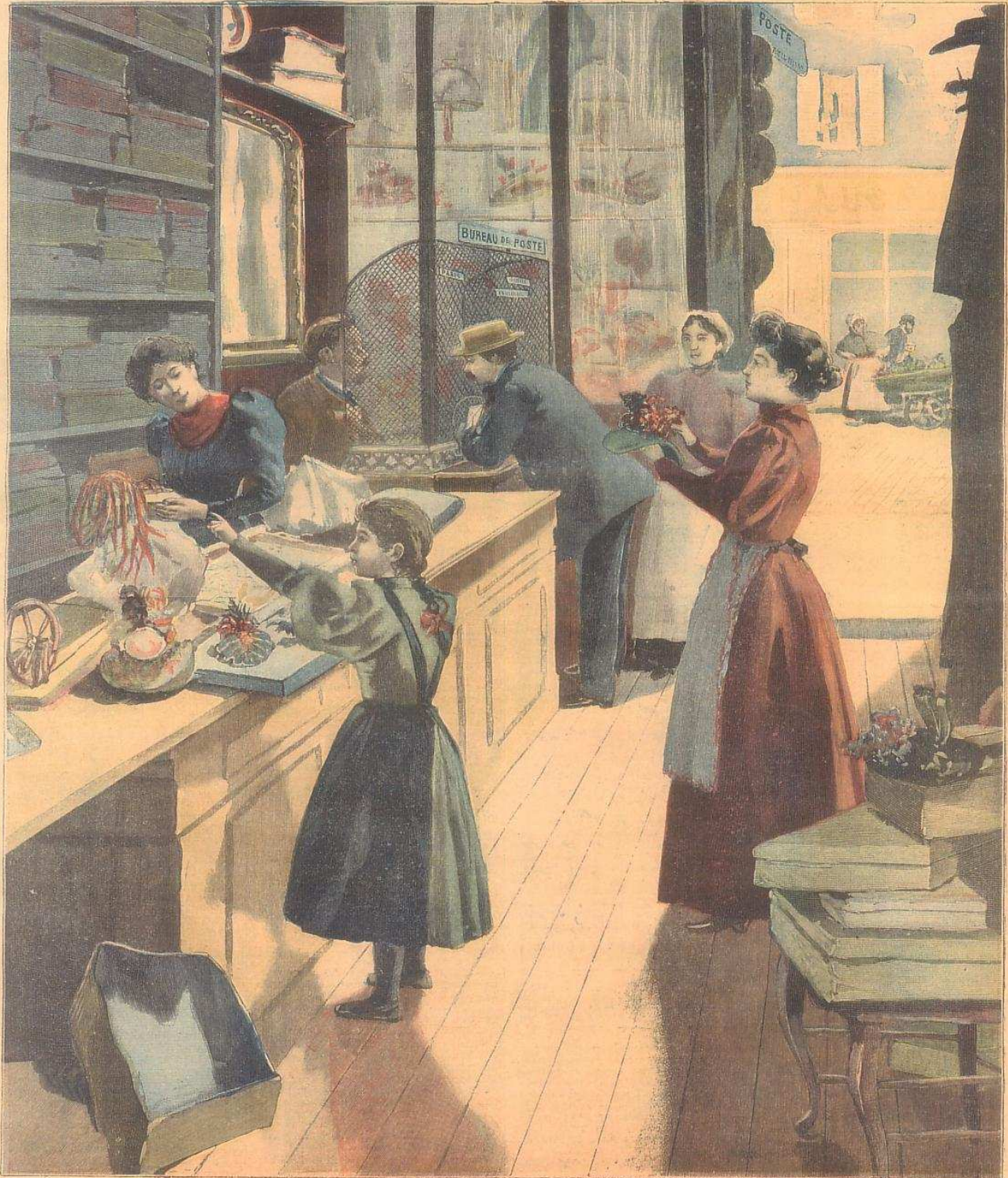
Nouveaux bureaux de poste auxiliaires à Paris