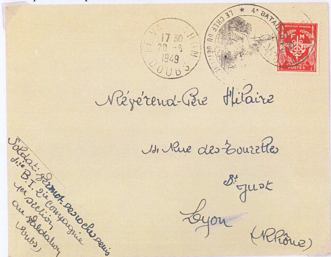
Oblitération manuelle Lettre du 20/6/1949 de Levaldahon

La règle est: le vaguemestre doit apposer son cachet d'unité sur le timbre de Franchise Militaire. Le cachet du vaguemestre annule le timbre et indique à la Poste que la lettre peut être acheminée sans encombres vers son destinataire