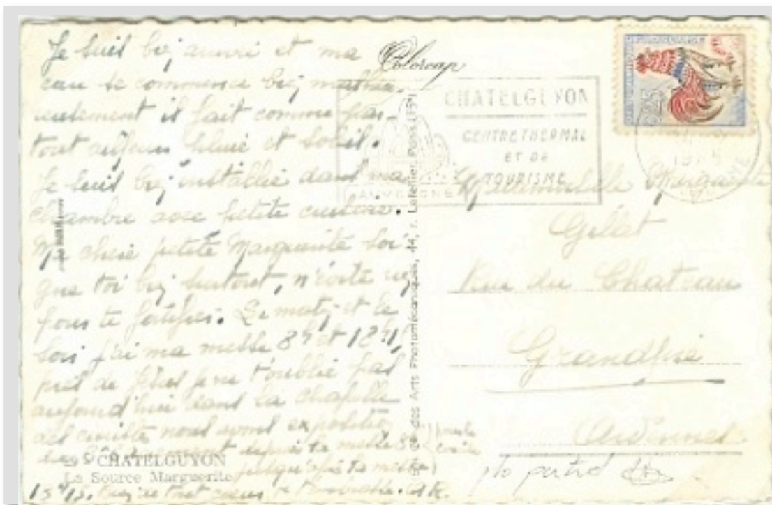
Carte postale affranchie à 0,25 franc à l'aide d'un timbre-poste partiellement jaune pâle fluorescent, suivant le tarif du 18 janvier 1965.

Utilisation exceptionnelle hors de la région parisienne.