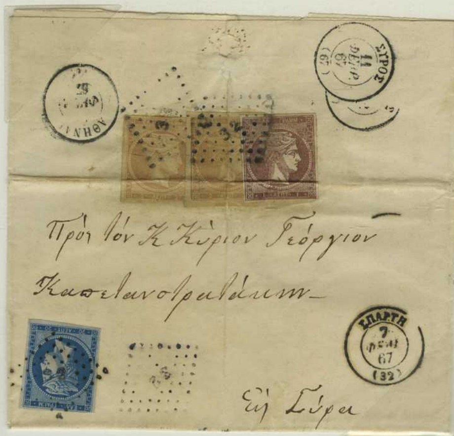
Lettre au départ de Sparte (32) le 7/19 février 1867, arrivée à Syros (67) le 11/23 février 1867, via Athènes (1). A noter : le postier a indiqué la présence de timbres au verso en apposant le cachet à losange à côté du timbre, sur le recto de la lettre.