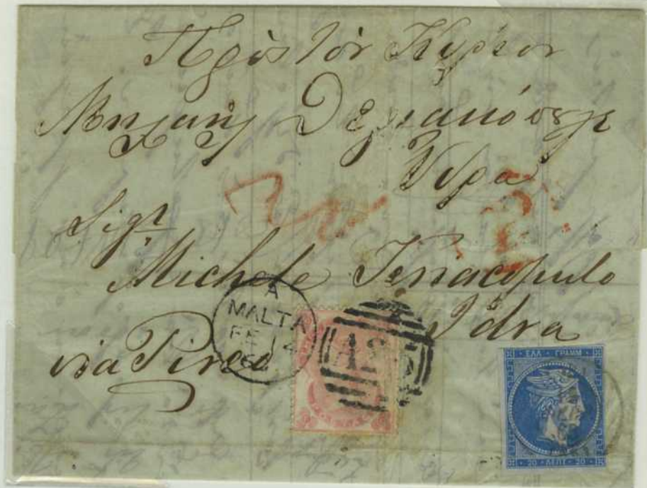
Lettre au départ de Malte le 2/14 février 1863, affranchie avec un timbre de 3 pence à l'effigie de la Reine Victoria , arrivée à Hydra (65), le 15/27 février 1863, et taxée au tarif territorial, de 20 lepta, pour une lettre jusqu'à 15 grammes, via Le Pirée (2), le 7/19 février 1863.