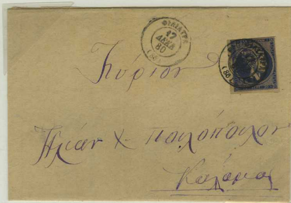
Lettre de Filiatra (86) du 17/29 décembre 1880 pour Calamata (31). A noter : le postier a utilisé un timbre ayant déjà servi ! (Double oblitération sur le timbre).