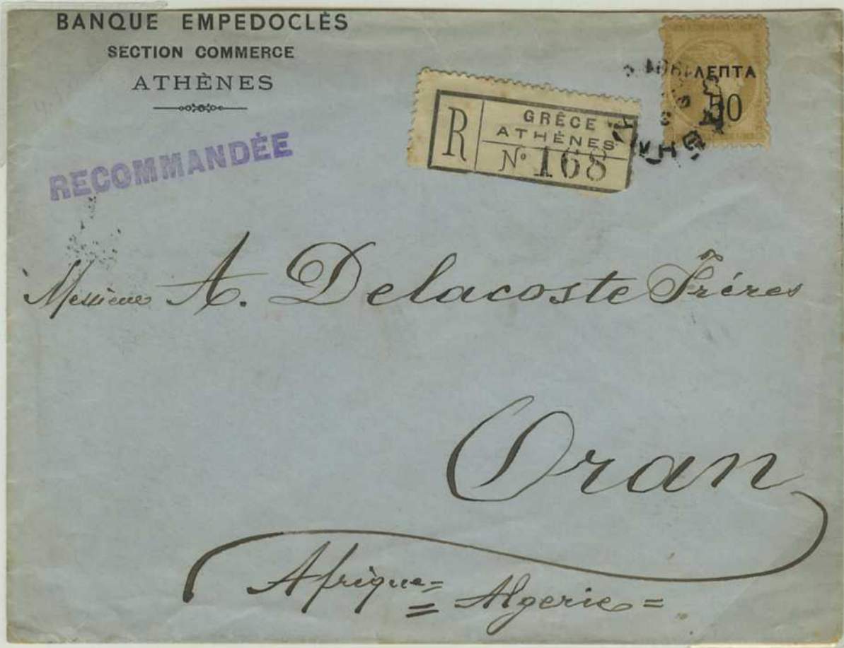
Lettre recommandée au départ d' Athènes (1) pour Oran , via Marseille , le 14/26 janvier 1901.