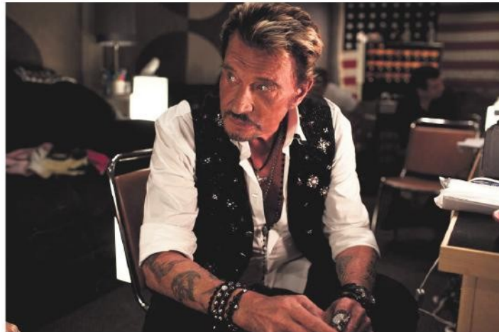
Le dernier passage de Johnny à Epernay s'était très bien passé, ce qui a joué dans la décision de revenir.